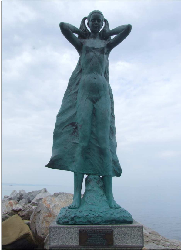
Trieste - Mura de barcala