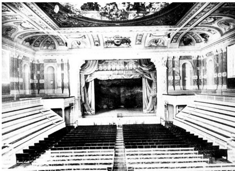
Interni del Teatro Mauroner

Dal rogo dell'Anfiteatro Mauroner sorse nel 1879 il Teatro Fenice (chiuso pochi anni fa per dar spazio ad un parcheggio altipiano), sala di grandi proporzioni, opera dell'architetto Ruggero Berlam. La sua costruzione, fortemente desiderata dalla città, fu concepita per ospitare generi di spettacolo tra i più di-